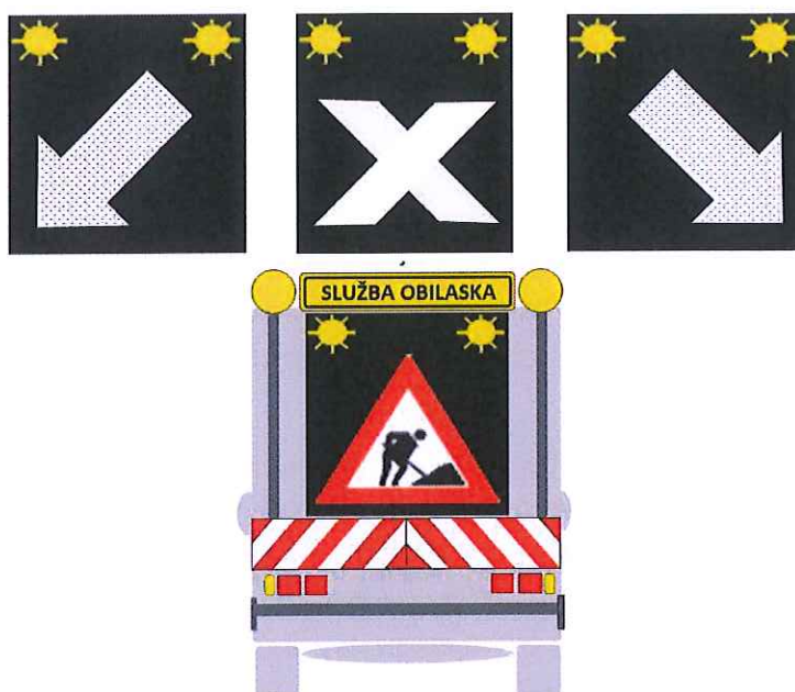
Слика 1 Изглед возила за обилазак са задње стране

Начин обележавања возила за обилазак је: