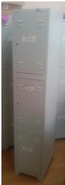
Слика 1. Метални гардеробни ормарић, троделни