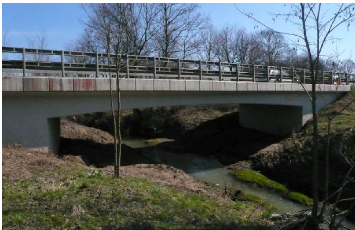
Slika 5. Vodotok na stacionaži km 2+382

Na poddeonici 1, postoje dva vodotoka koji se ukrštaju sa putem i čije je uređenje obrađeno projektom, u cilju zaštite od bujica i zaštite trupa puta.