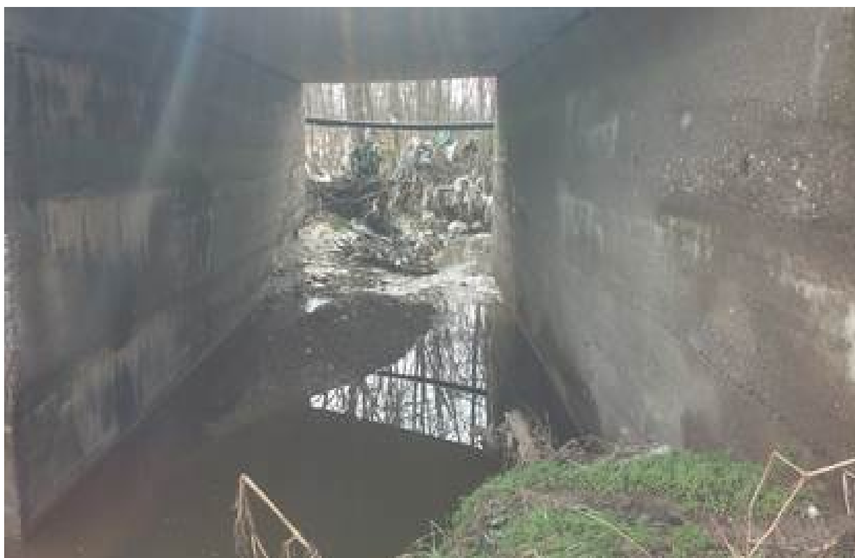
Slika 9. Vodotok na stacionaži km 6+214 (potok Bojovac)