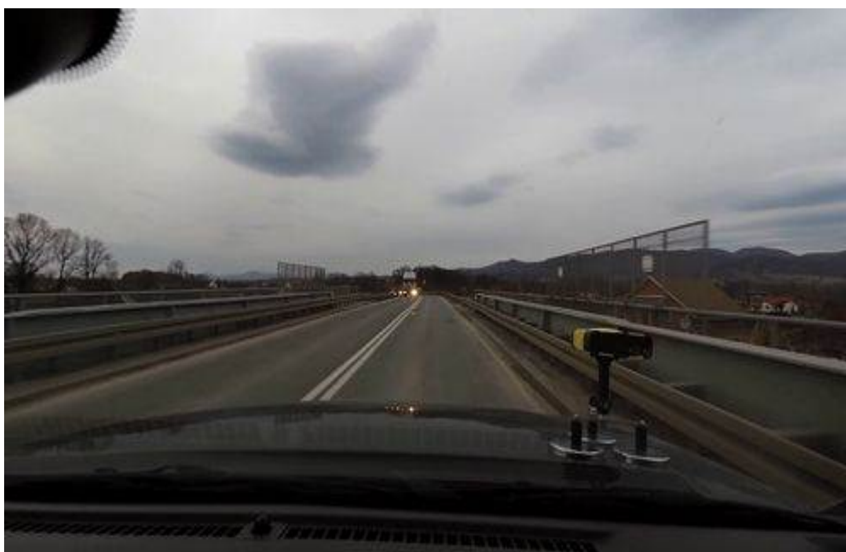
Slika 21. Nadvožnjak na izlazu iz naselja Adrani, gledano u smeru rasta stacionaže