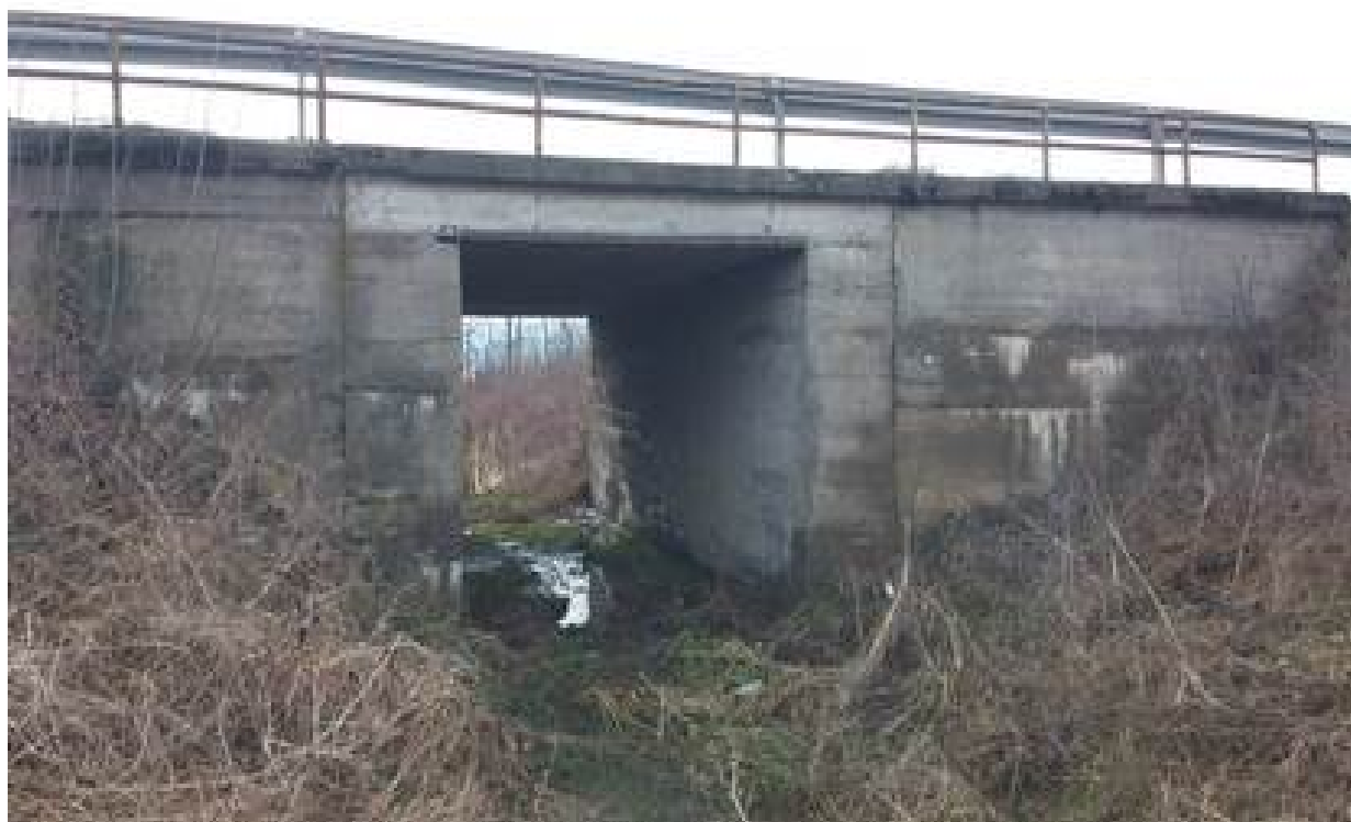
Slika 12. Vodotok na stacionaži km 7+645