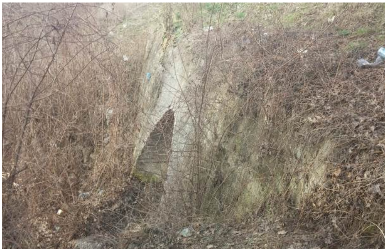
Slika 16. Vodotok na stacionaži km 10+934