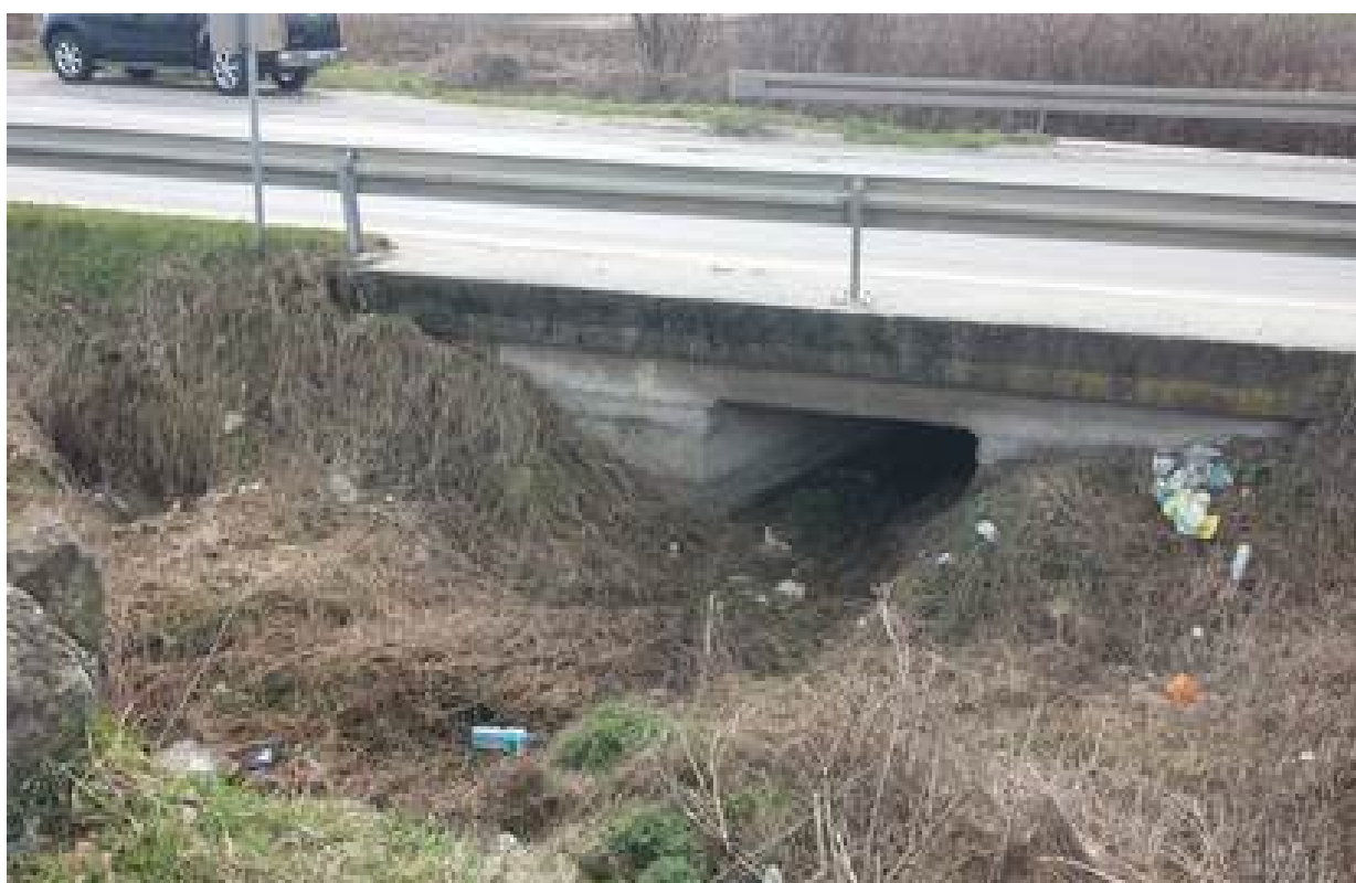
Slika 11. Vodotok na stacionaži km 7+278