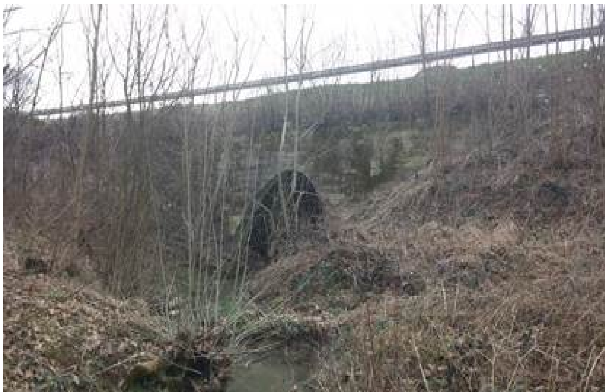
Slika 14. Vodotok na stacionaži km 9+535