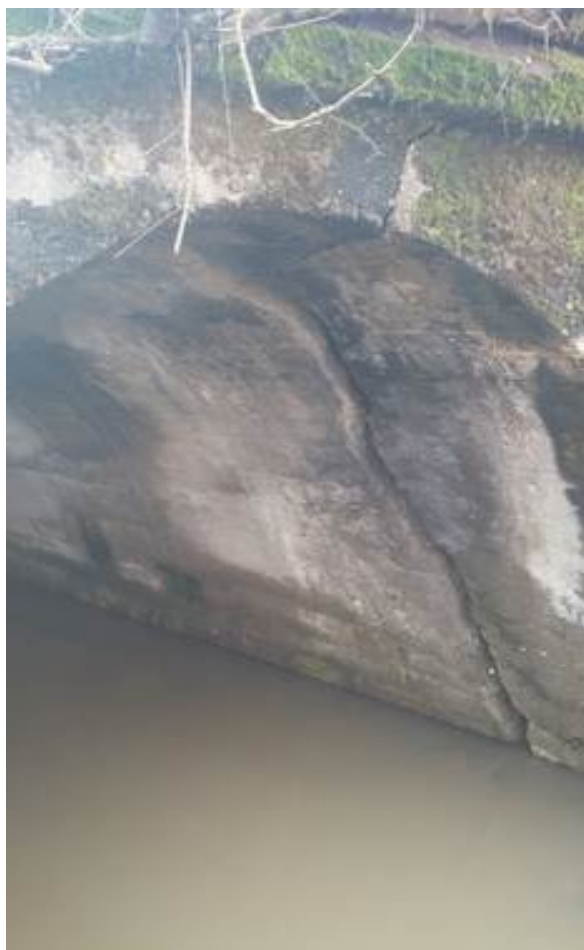
Slika 6. Vodotok na stacionaži km 4+966

Projektom se predviđa oblaganje dna reno madracima i oblaganje obala gabionskim zidovima u odgovarajućoj dužini, kao i čišćenje rečnog toka od nanosa i rastinja.