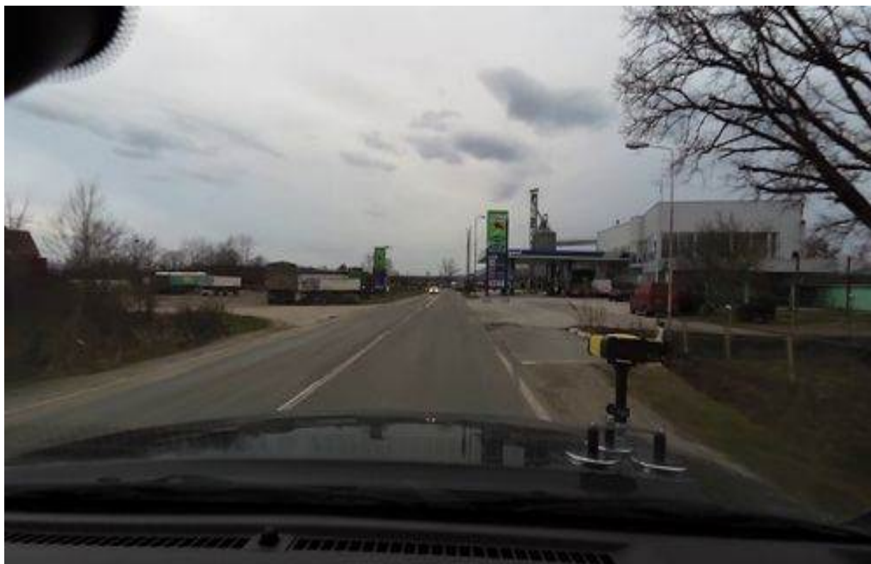
Slika 4. Primer ivične izgradnje

Na poddeonici 1, postoje dva vodotoka koji se ukrštaju sa putem i čije je uređenje obrađeno projektom, u cilju zaštite od bujica i zaštite trupa puta.