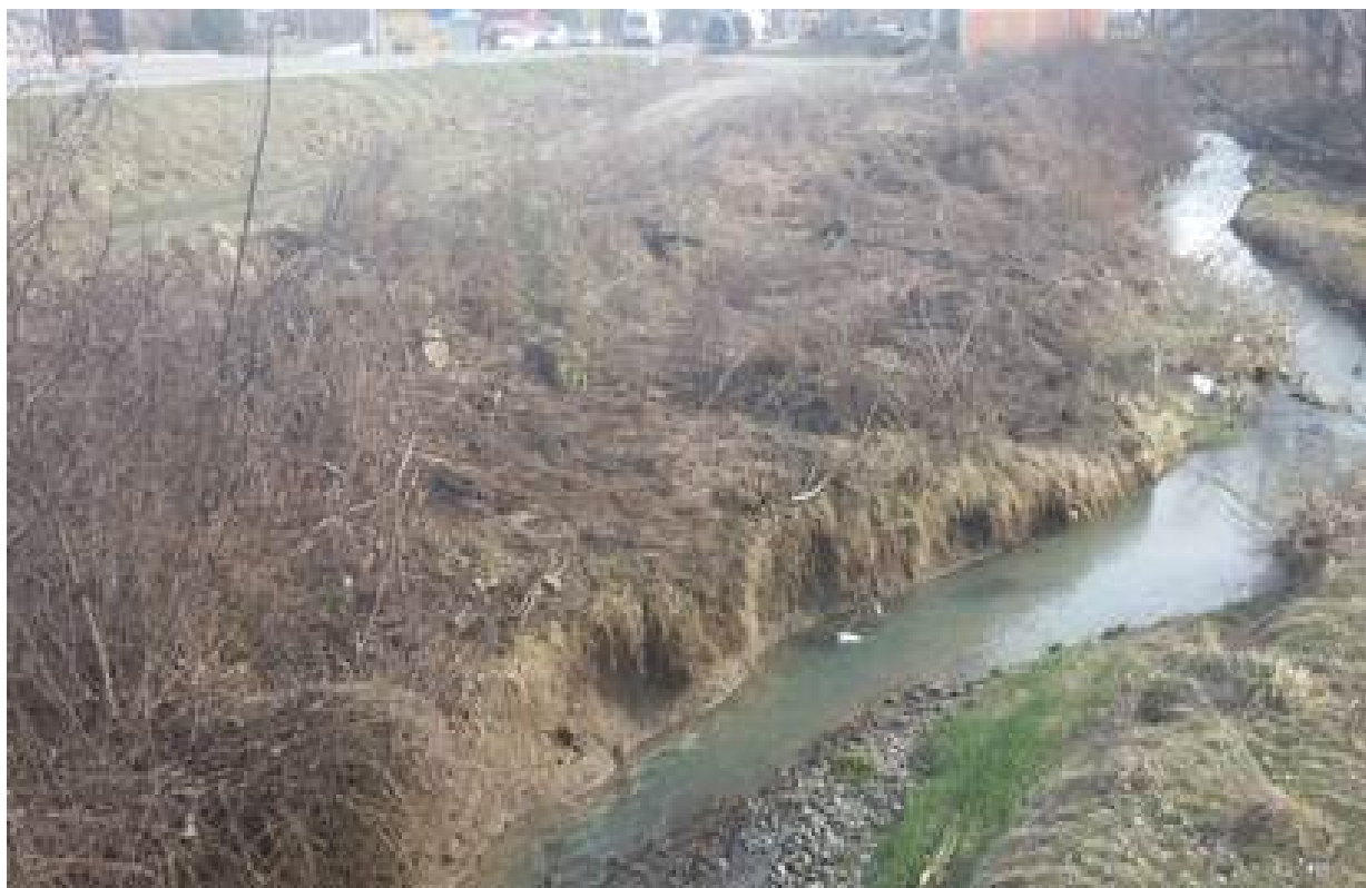
Slika 18. Vodotok na stacionaži km 11+330 (obaloutvrda u Miločaju)

Projektom je predviđena regulacija potoka Bojovac, oblaganjem dna reno madracima, a obala gabionskim zidom visine 1m. Zatim, regulacija Lađevačke reke, izradom reno madraca i obaloutvrde upotrebom gabiona visine 2m; potoka Gradinac, izrada gabionskog zida u cilju zaštite obale od sufozije; potoka Gradinac u Miločaju izradom obaloutvrde upotrebom gabiona visine 2m. Kod ostalih vodotokova, nisu predviđeni regulacioni radovi izuzev čišćenja dna propusta i rečnog toka.