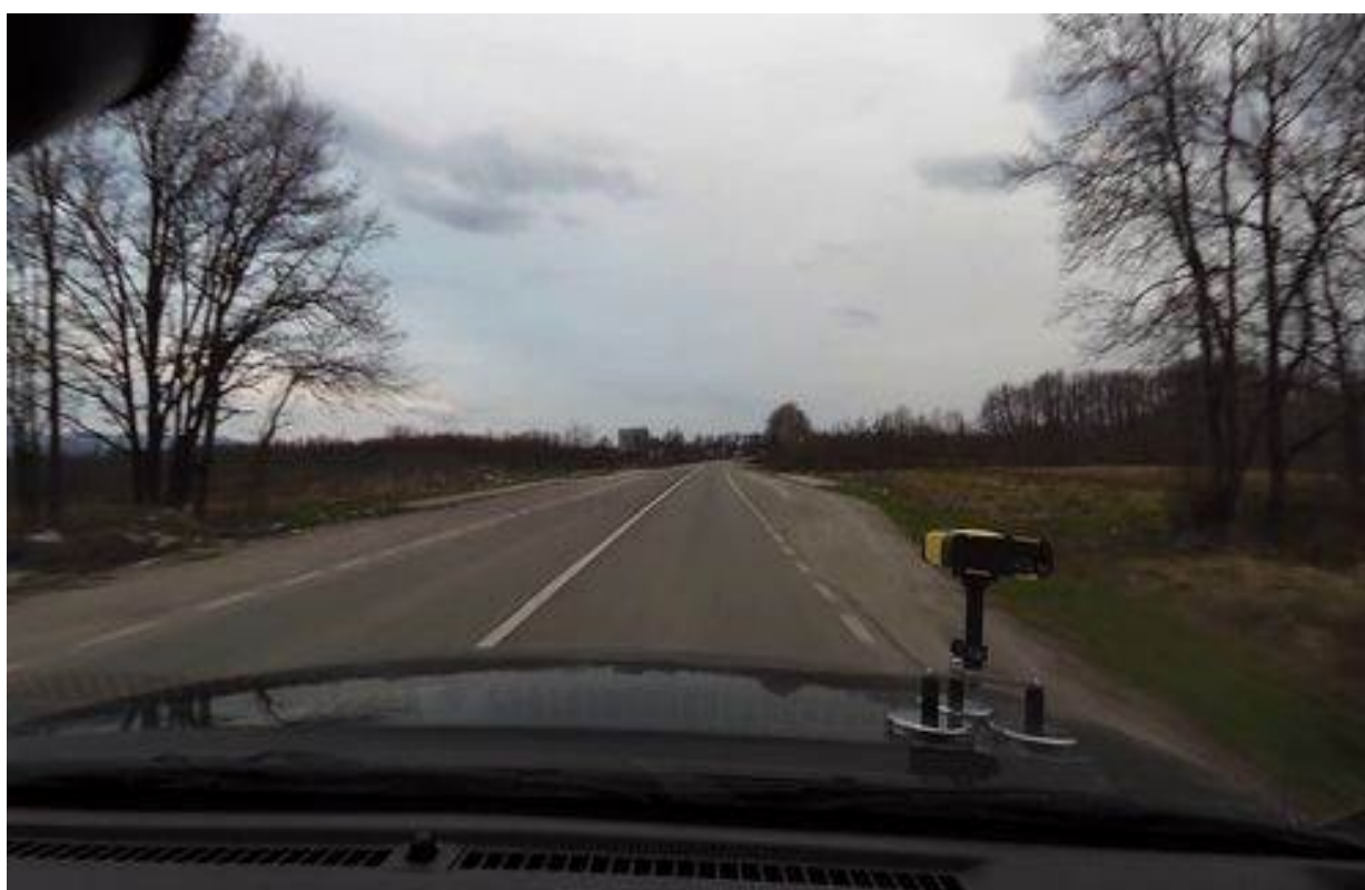
Slika 3. Lokacija jednog od tri autobuska stajališta na trasi