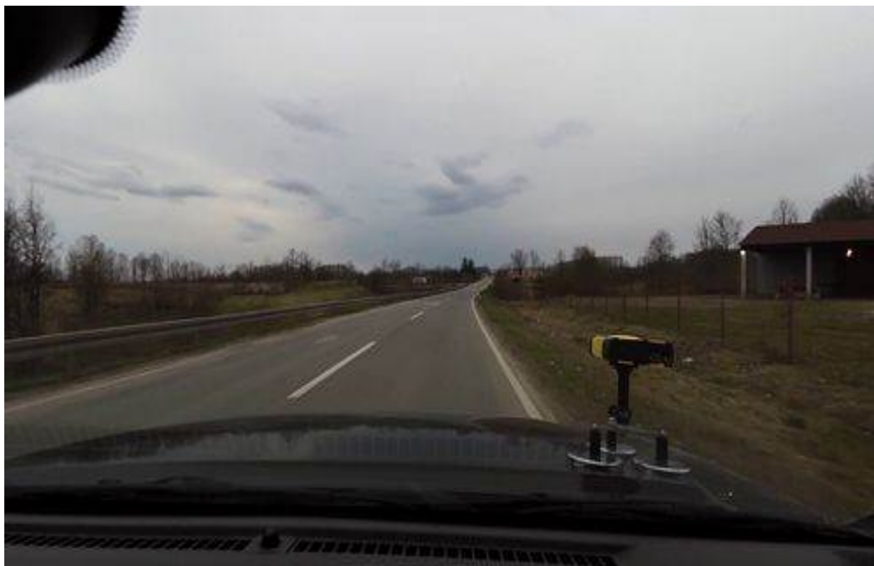
Slika 8. Deo trase na nasipu višem od 3m, sa desne strane gledano u smeru rasta stacionaže