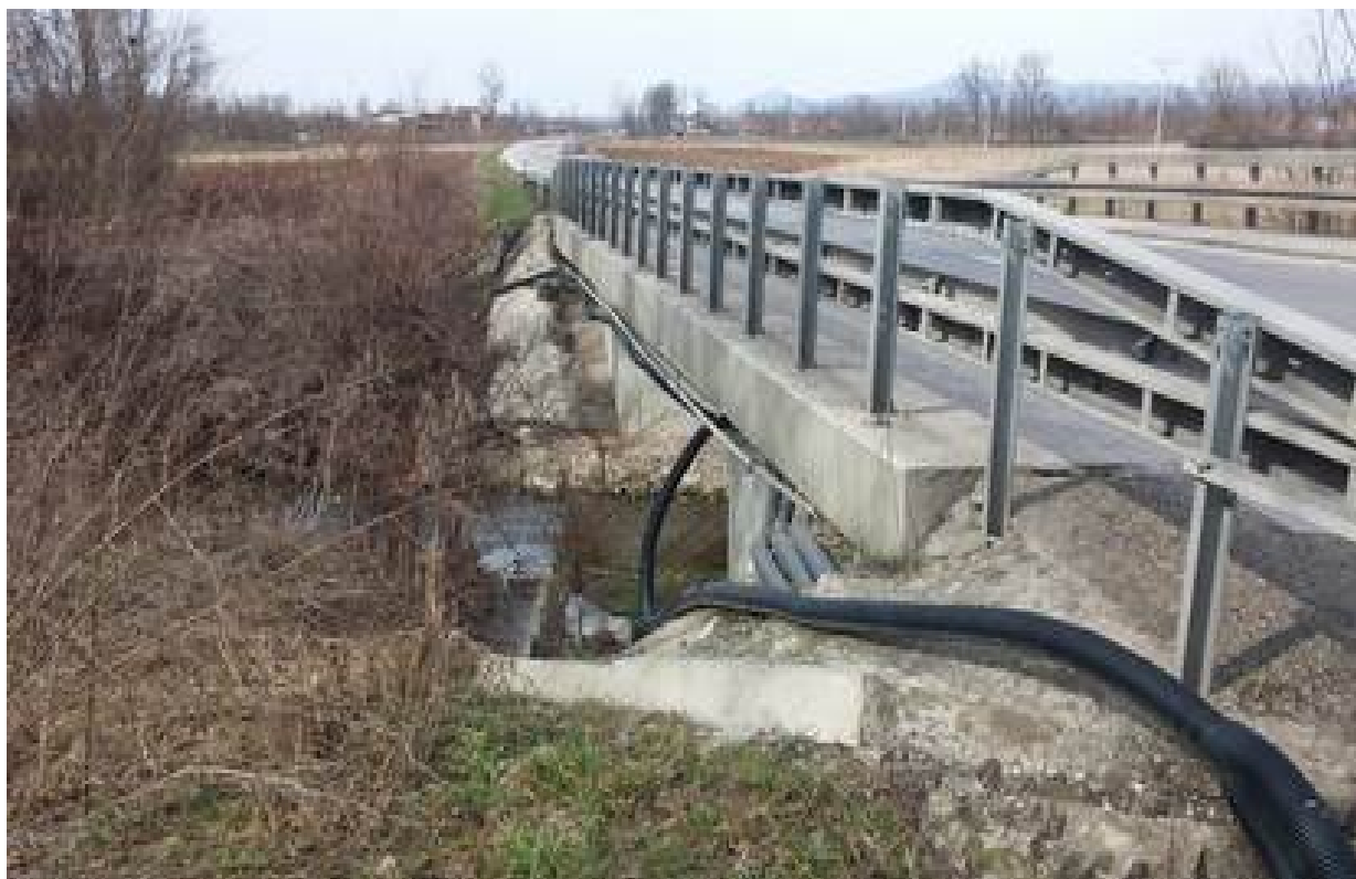
Slika 10. Vodotok na stacionaži km 6+592 (Lađevačka reka)