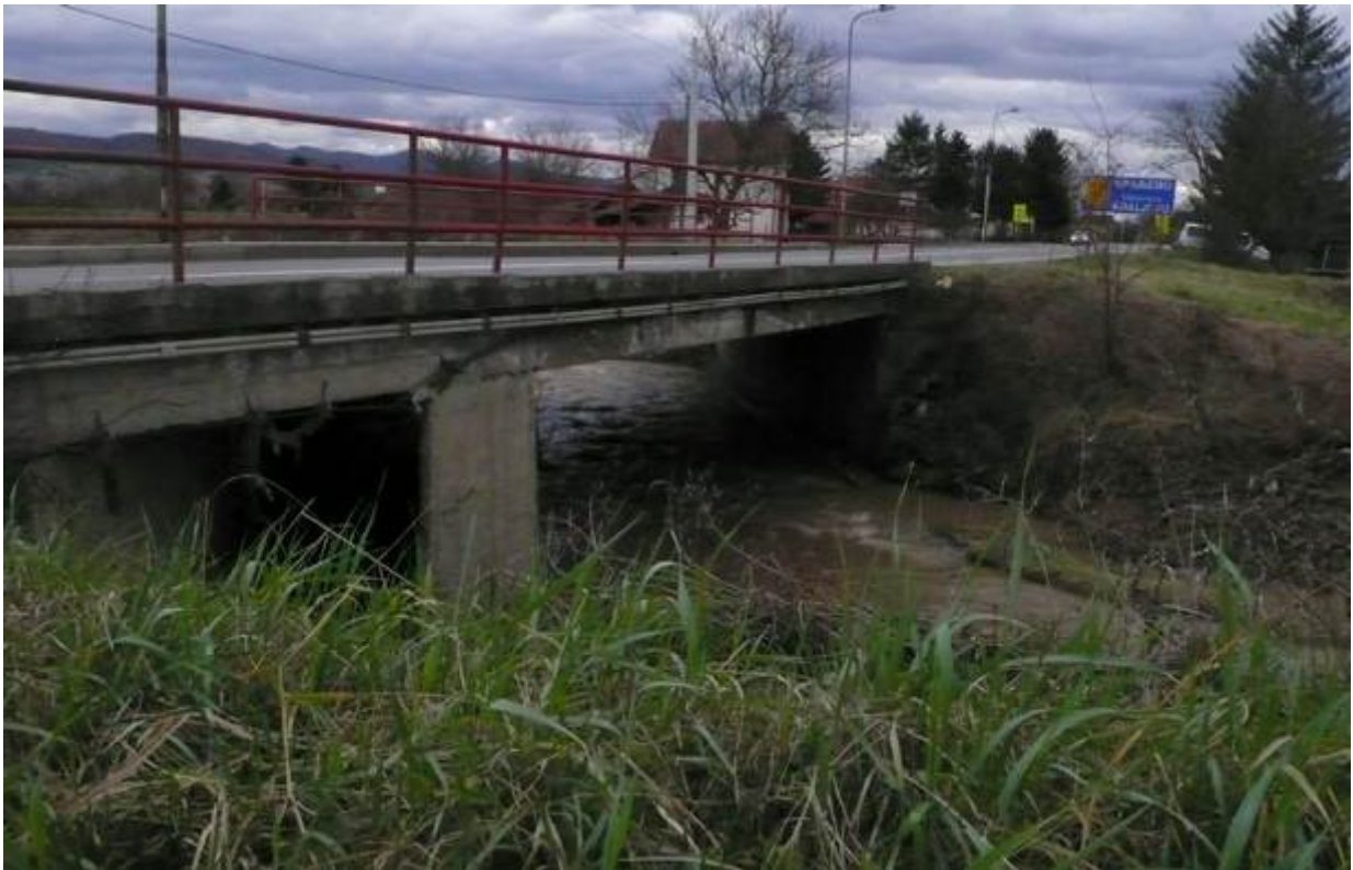
Slika 22. Vodotok na stacionaži km 15+870 (Musina reka)