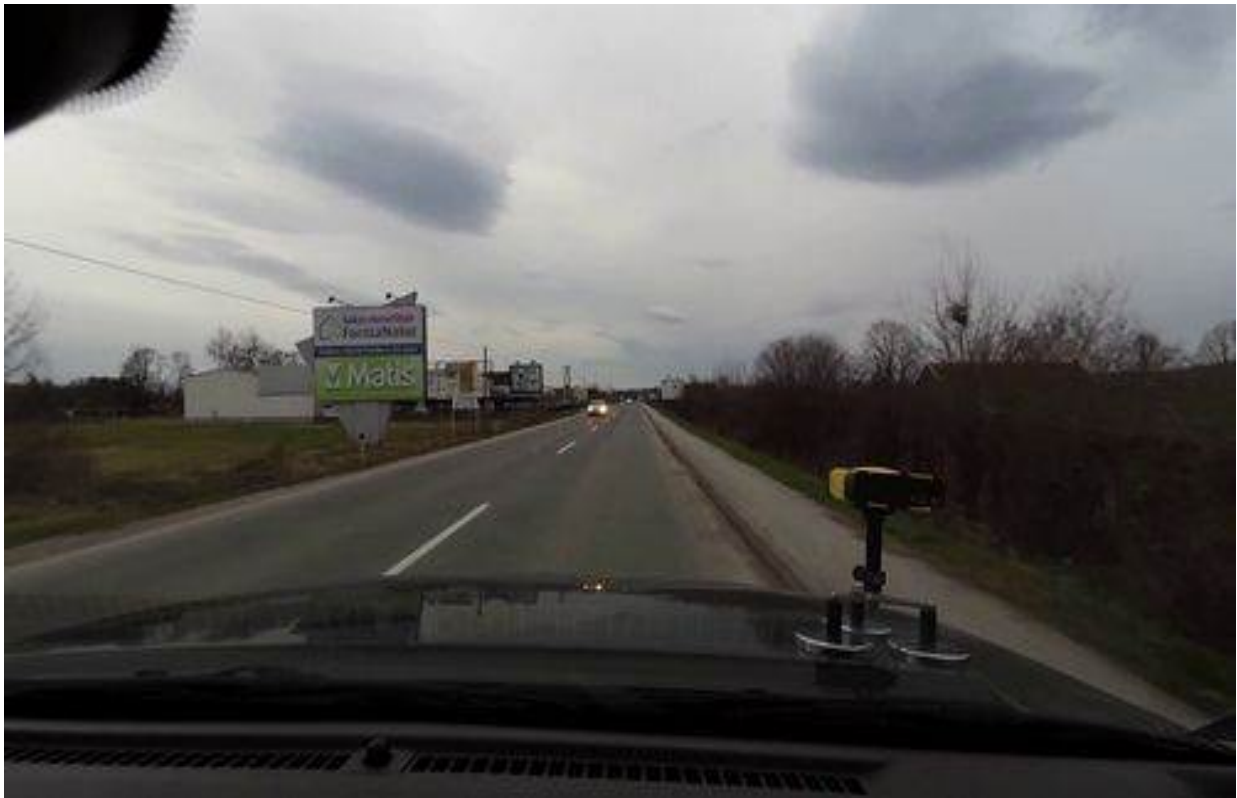
Slika 19. Deonica van naselja na poddeonici 3

Na delu predmetne poddeonice postoji izgrađena atmosferska kanalizacija. Voda se sa kolovoza prikuplja pomoću slivnika.