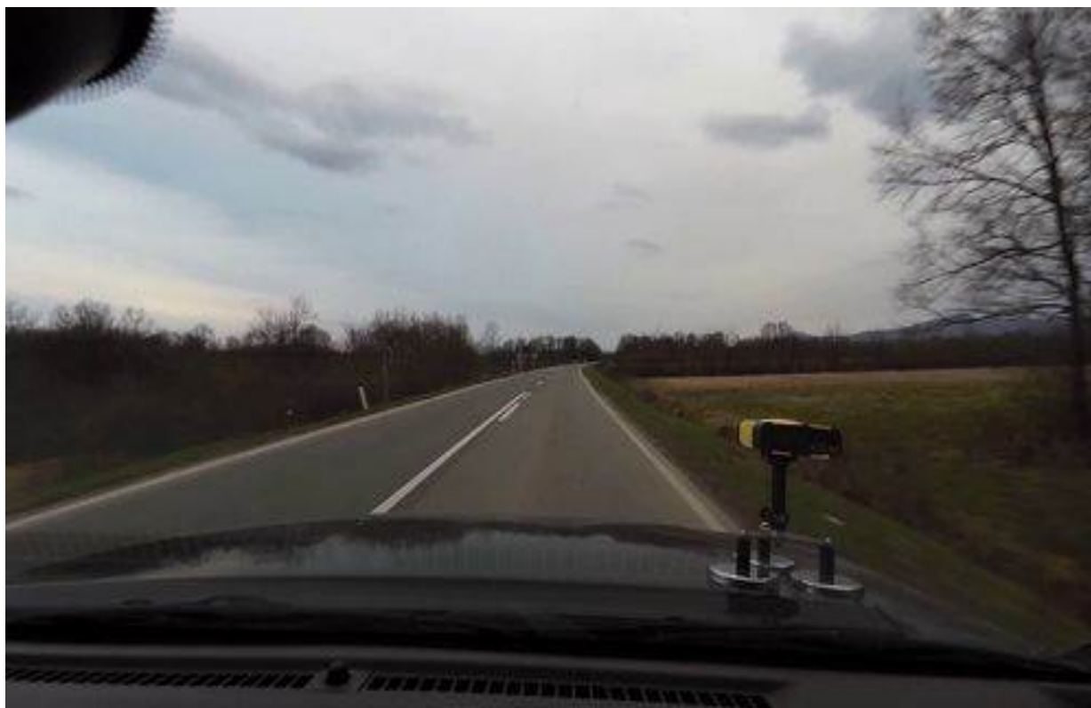
Slika 2. Tipičan izgled trase na poddeonici 1