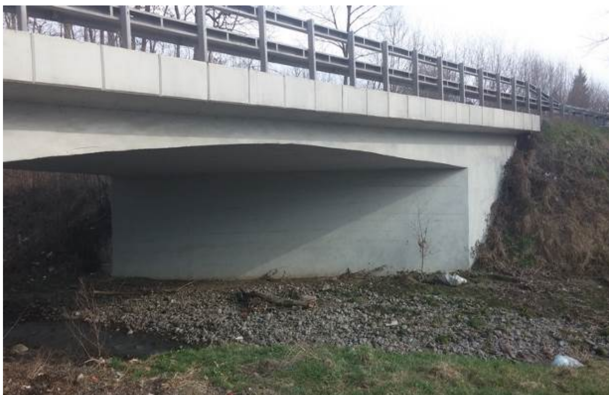
Slika 17. Vodotok na stacionaži km 11+050 (potok Gradinac)