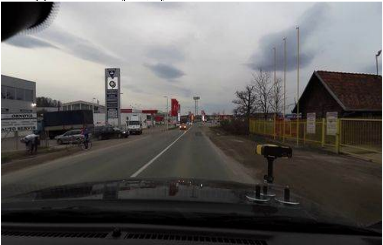
Slika 23. Tipičan izgled trase na poddeonici 4

Od skretanja postoji samo skretanje ka megamarketu "Tempo" i ostalim objektima u industrijskoj zoni. Postoji jedno autobusko stajalište, koje se zadržava.