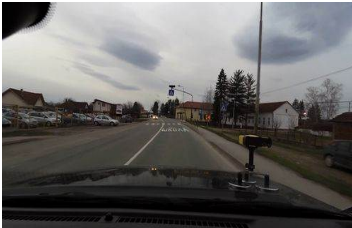
Slika 20. Deonica u naselju (Adrani)