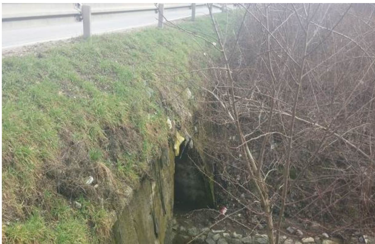
Slika 15. Vodotok na stacionaži km 10+189 (potok Đurašinac)