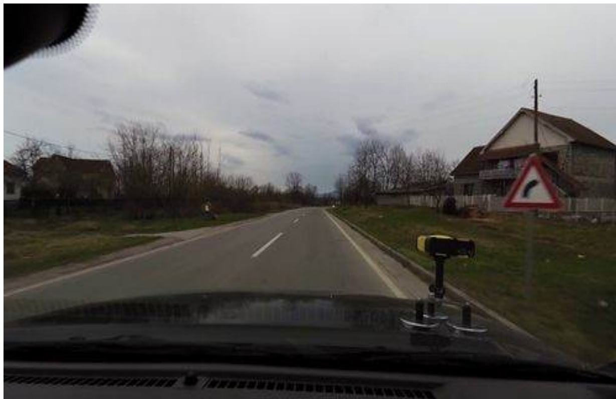
Slika 7. Tipičan izgled trase na poddeonici 2

Projektom se predviđa čišćenje propusta i primena određenih mera u cilju poboljšanja njihove funkcije, dok su mostovi u dobrom stanju.