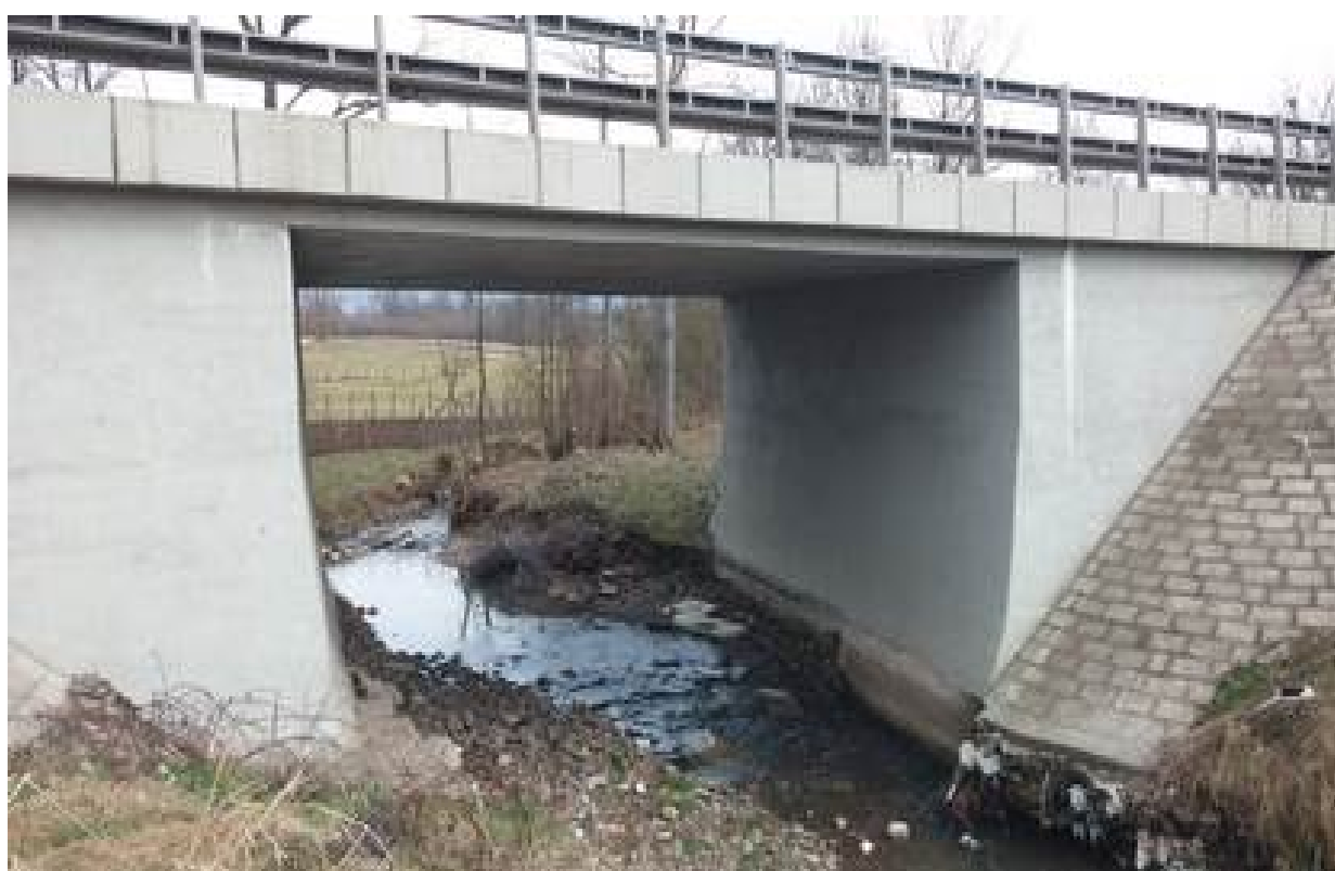
Slika 13. Vodotok na stacionaži km 8+180 (Buban potok)