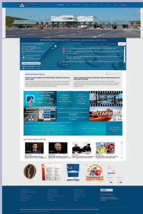
Интернет презентација ЈП „Путеви Србије“

Одељење за односе са јавношћу активно се бави широким спектром активности из делокруга свог рада и једна од надлежности Одељења је интернет презентација предузећа за коју очекујемо да до краја године забележи преко 650 000 посета и више од 1 200.000 прегледаних страна.